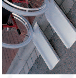
Rollstuhl-Flamme HMV-Nr.: 22.50.01.0