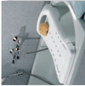
Badewannenbrett HMV-Nr.: 04.40.02.0