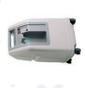
Sauerstoffkonzentrator HMV-Nr.: 14.24.04.0