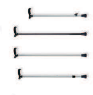
Gehstöcke HMV-Nr.: 10.50.01.1