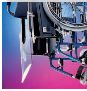
Therapietisch HMV-Nr.: 28.99.01.0