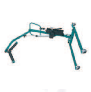
Personenlifter HMV-Nr.: 22.40.01.0