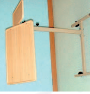
Beistelltisch HMV-Nr.: 50.45.04.0