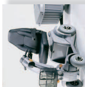
Scooter / Elektromobil HMV-Nr.: 18.51.05.1