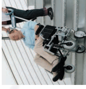
Treppensteighilfe HMV-Nr.: 18.65.01.1