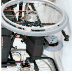
Rollstuhl-Zusatzantrieb Schubhilfe HMV-Nr.: 18.99.04.1