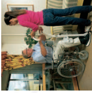
Umsetzhilfe HMV-Nr.: 22.29.01.0