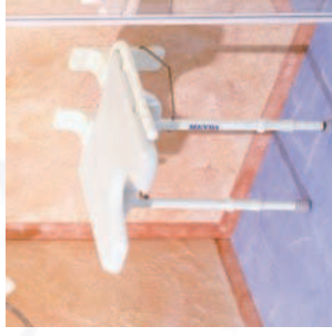
Duschklappsitz HMV-Nr.: 04.40.03.0