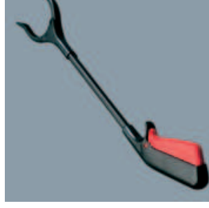
Greifzange HMV-Nr.: 02.40.04.1