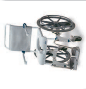
Duschrollstuhl HMV-Nr.: 18.46.03.0