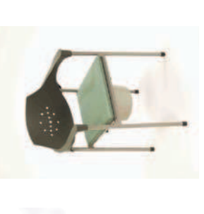
Toilettenstuhl HMV-Nr.: 33.40.04.0