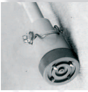
Gehstützen-Spikes HMV-Nr.: 10.99.01.0