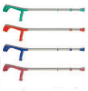
Unterarm-Gehstützen HMV-Nr.: 10.50.02.0