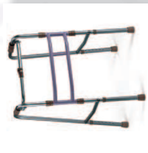
Gehgestell faltbar HMV-Nr.: 10.46.01.0